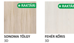
SONOMA TÖLGY 3D