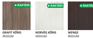
GRAFIT KŐRIS IRIDIUM